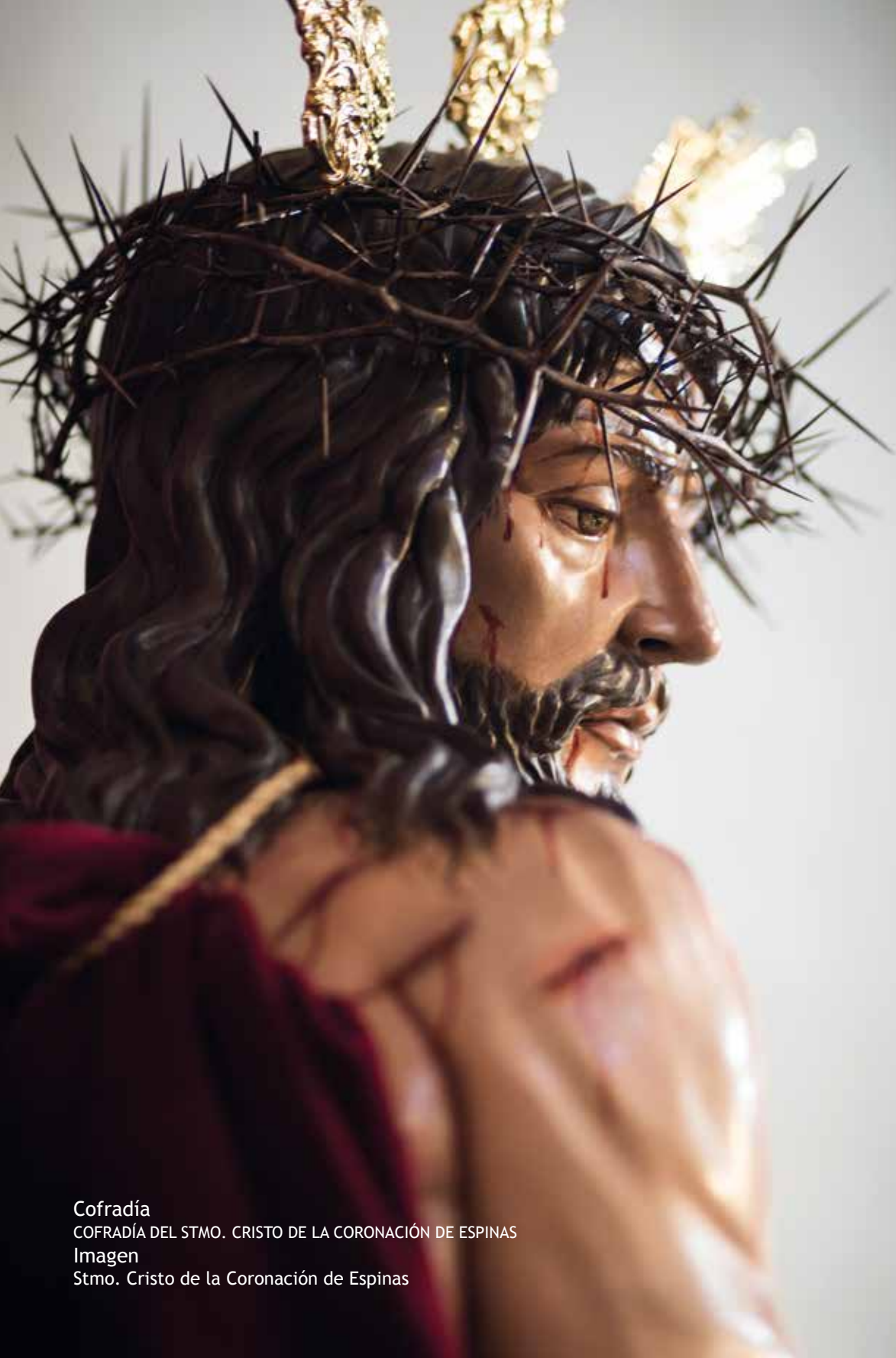
Cofradía COFRADÍA DEL STMO. CRISTO DE LA CORONACIÓN DE ESPINAS Imagen Stmo. Cristo de la Coronación de Espinas