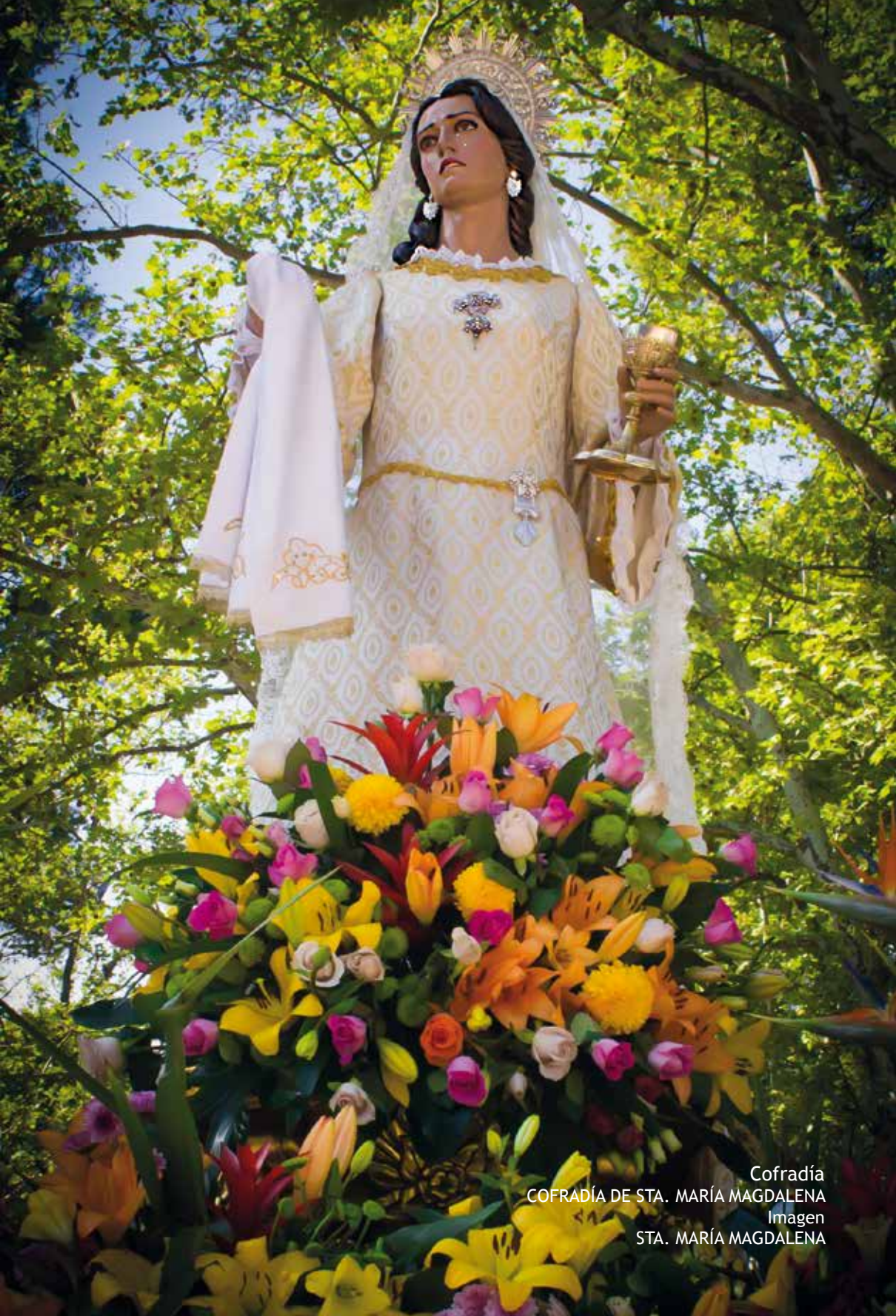
Cofradía COFRADÍA DE STA. MARÍA MAGDALENA Imagen STA. MARÍA MAGDALENA