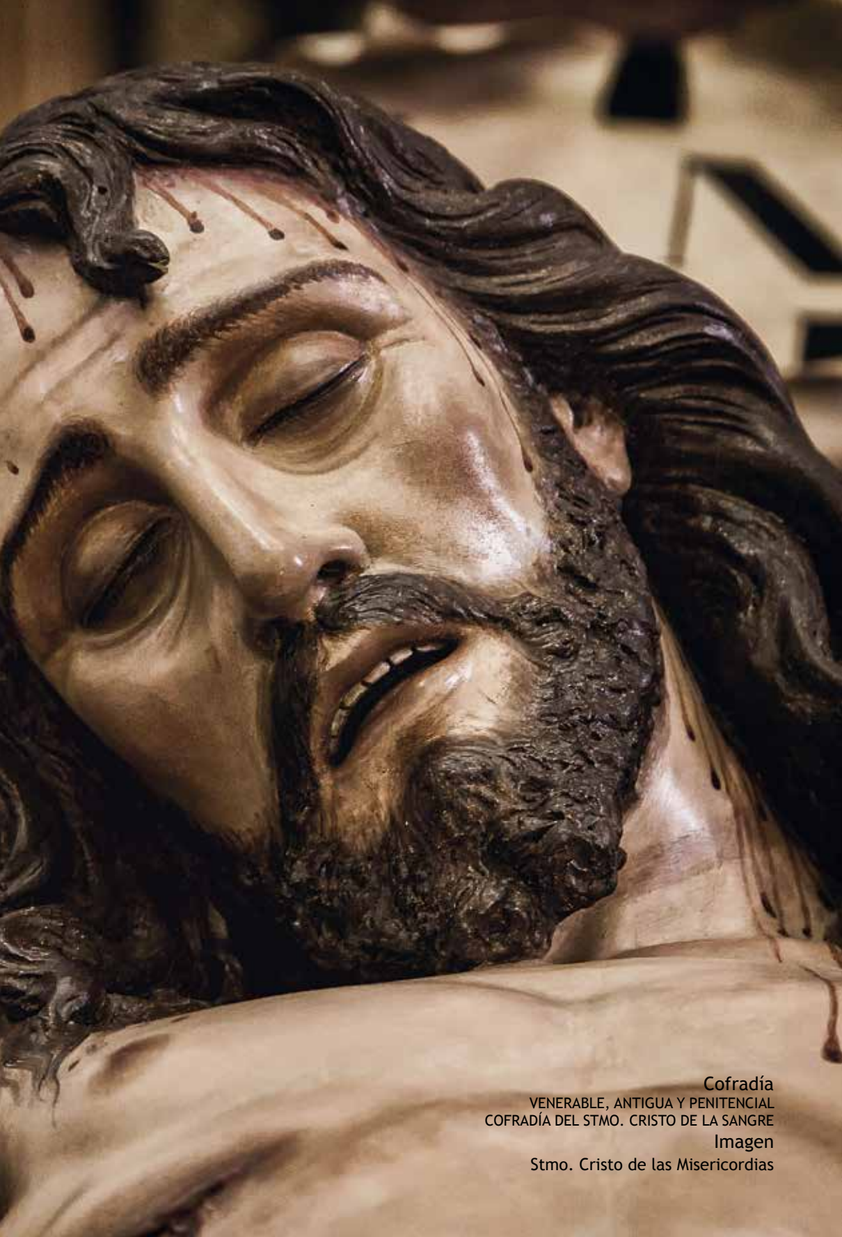
Cofradía VENERABLE, ANTIGUA Y PENITENCIAL COFRADÍA DEL STMO. CRISTO DE LA SANGRE Imagen Stmo. Cristo de las Misericordias