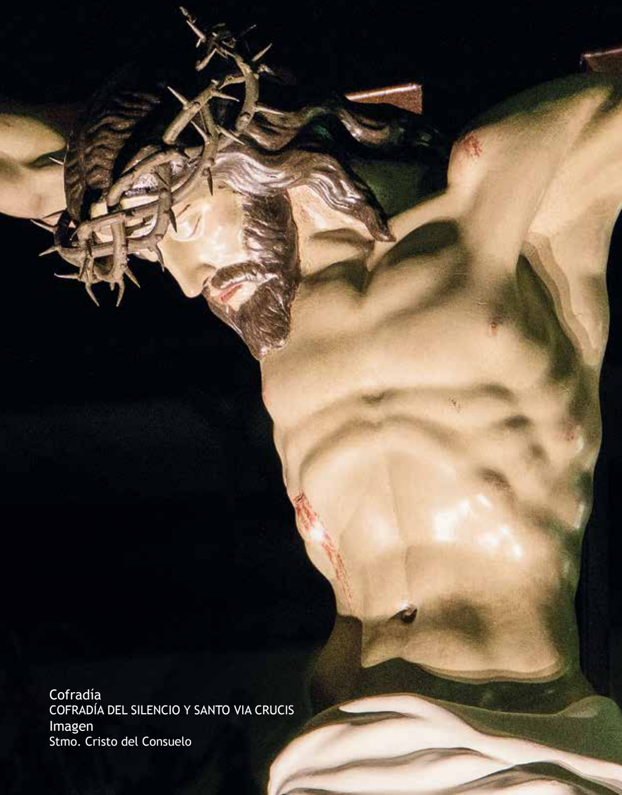
Cofradía COFRADÍA DEL SILENCIO Y SANTO VIA CRUCIS Imagen Stmo. Cristo del Consuelo