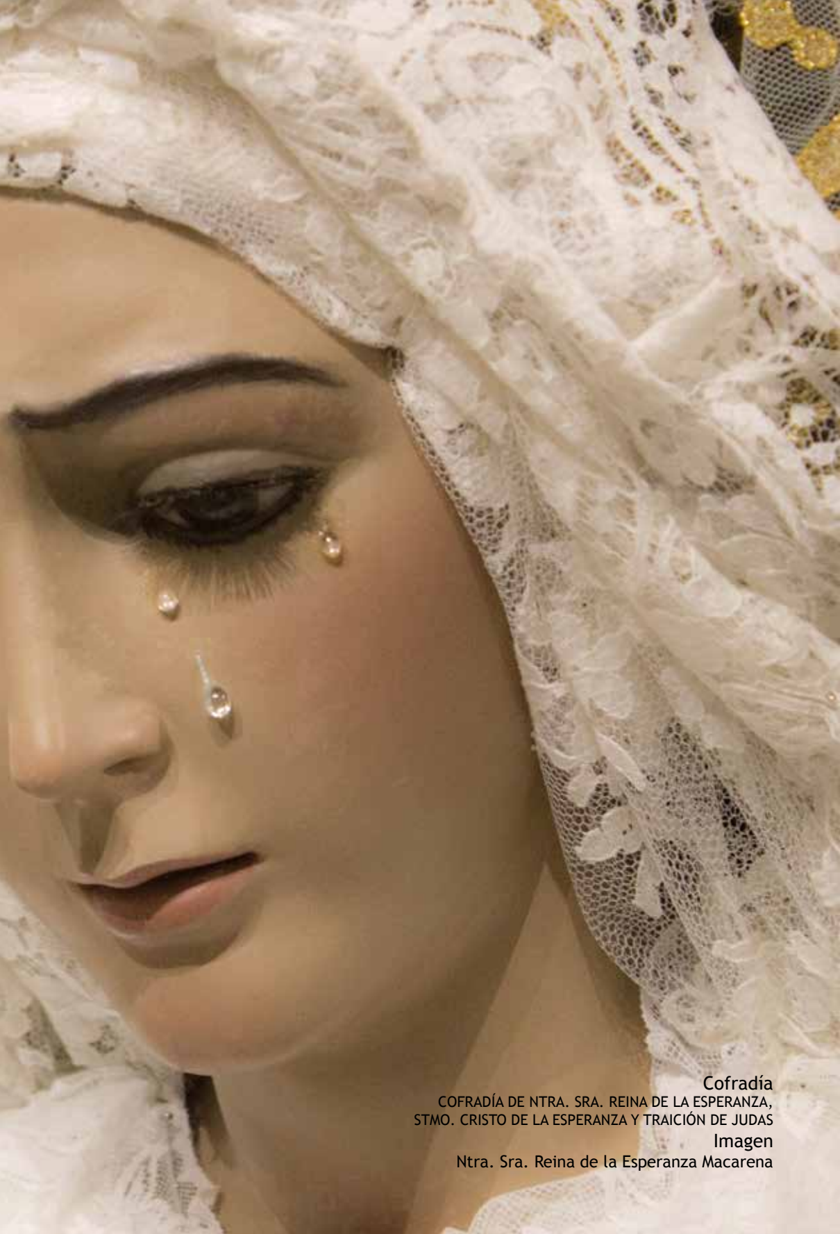
Cofradía COFRADÍA DE NTRA. SRA. REINA DE LA ESPERANZA, STMO. CRISTO DE LA ESPERANZA Y TRAICIÓN DE JUDAS Imagen Ntra. Sra. Reina de la Esperanza Macarena