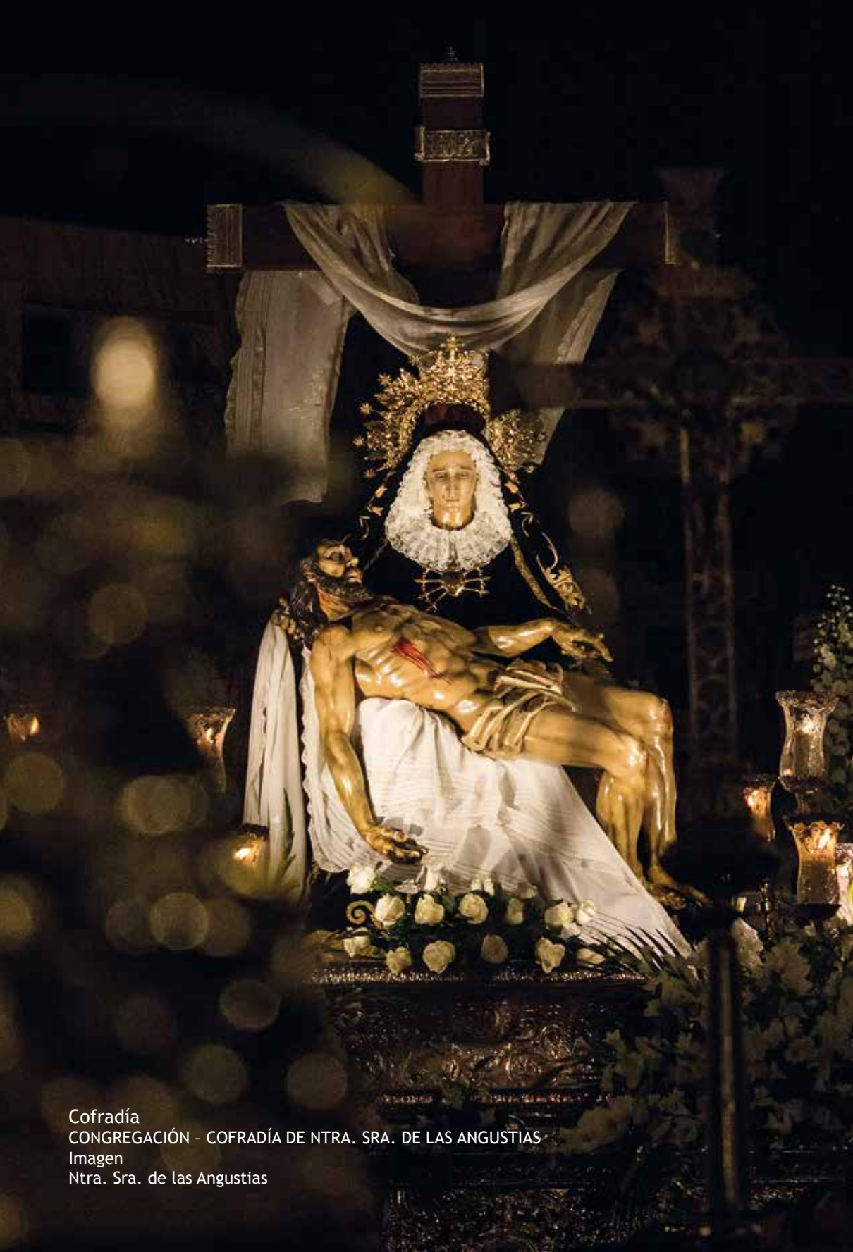
Cofradía CONGREGACIÓN - COFRADÍA DE NTRA. SRA. DE LAS ANGUSTIAS Imagen Ntra. Sra. de las Angustias